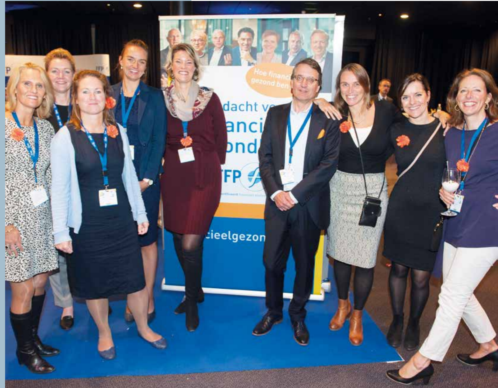
Medewerkers van het FFP bureau.