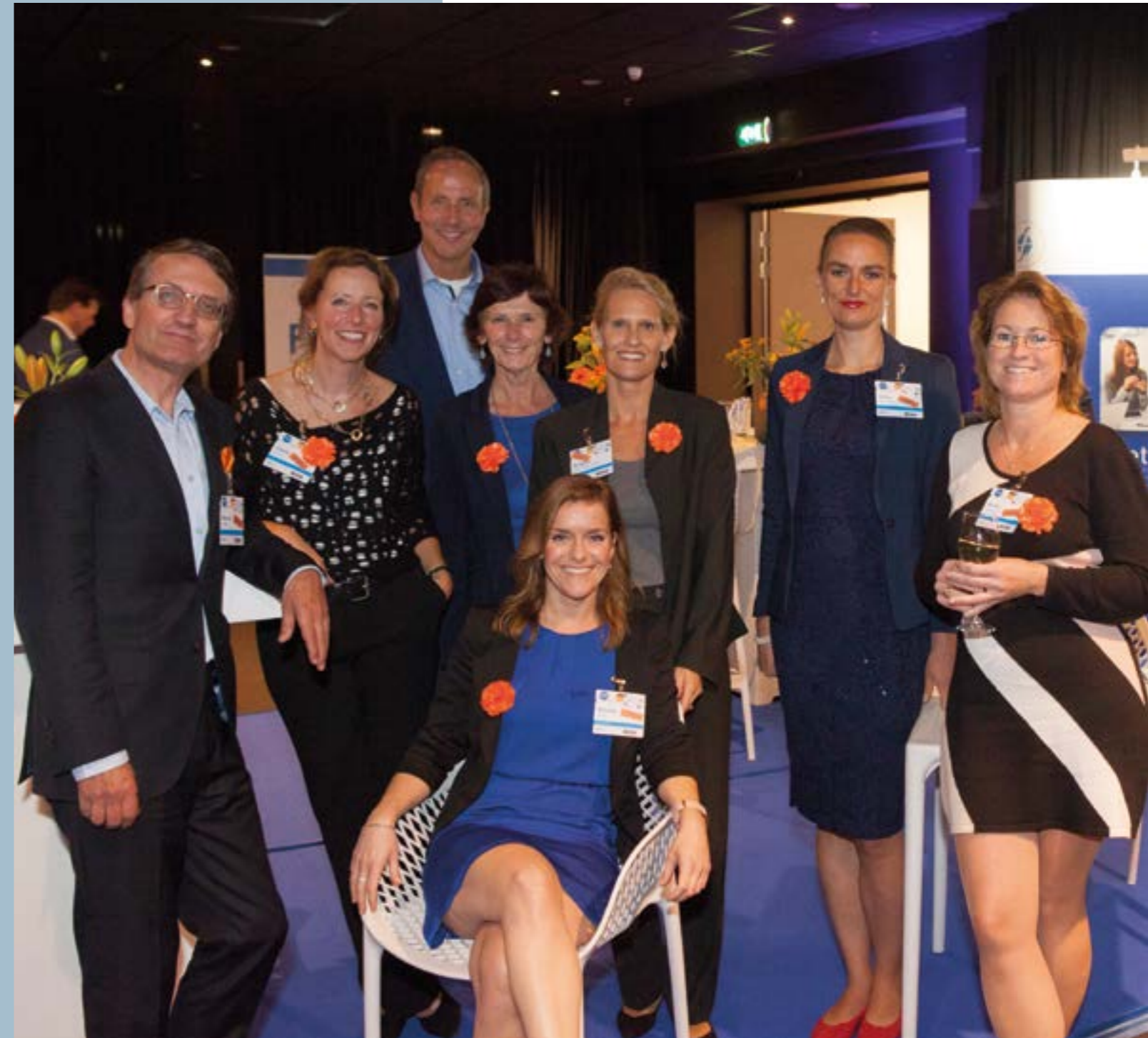
Medewerkers van het FFP bureau.